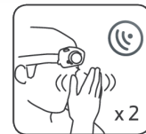
Capteur sans contact