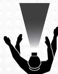
LAMPE FRONTALE STANDARD