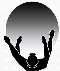
LAMPE FRONTALE I-VIEW